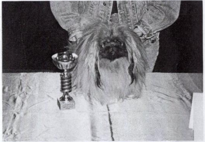
KLUBOVÝ CHAMPION PEKINÉZ KLUBU SIDNY OF TOMDOR Svámí