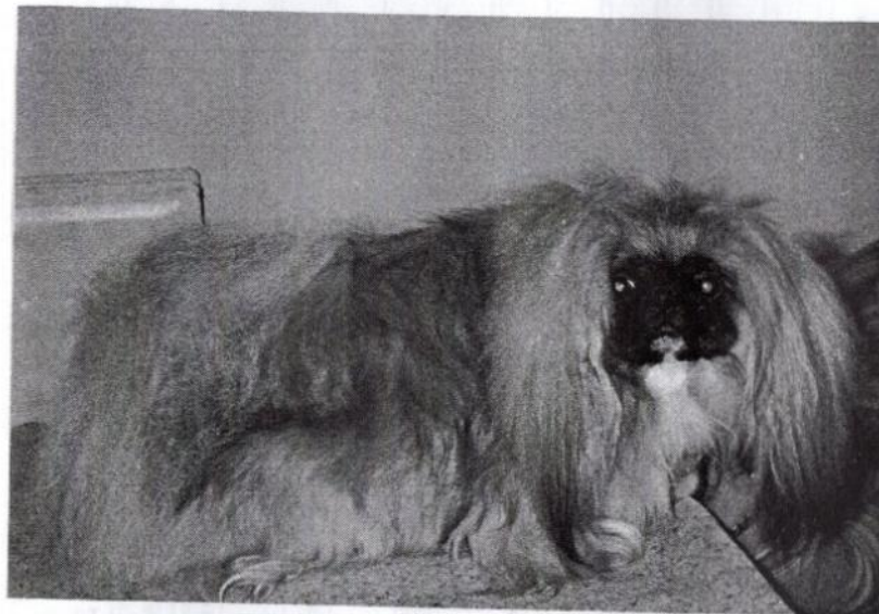
JUNIOR CHAMPION PEKINÉZ KLUBU TREASURE GOLD Svámí