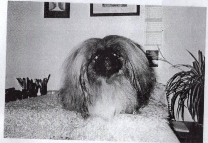
KLUBOVÝ CHAMPION PEKINÉZ KLUBU GLAMOURGIRL