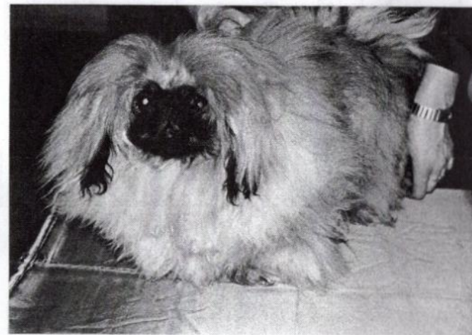
JUNIOR CHAMPION PEKINÉZ KLUBU TESSIE -GIRL Svámí