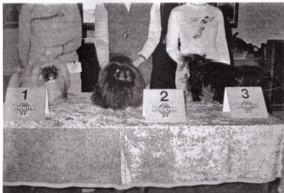
třída otevřená - feny