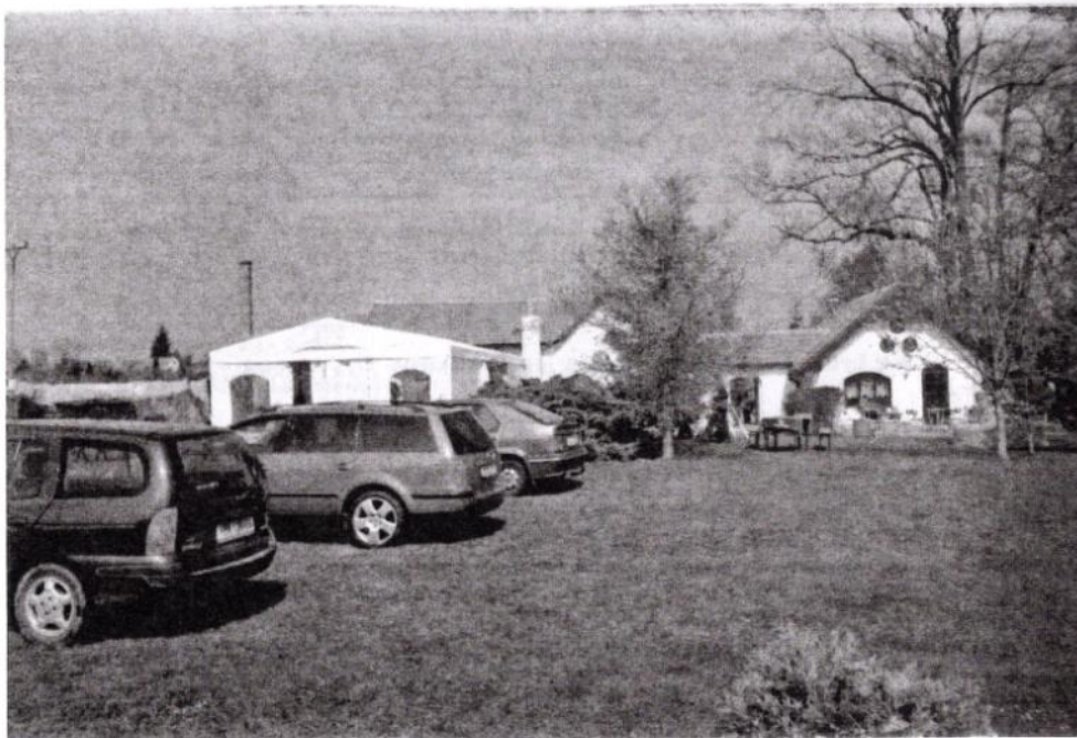
Areal restaurace Koliba - Dolíně

ceny pro vítěze Speciální výstavy věnoval Pekinés Klub a sponzoři