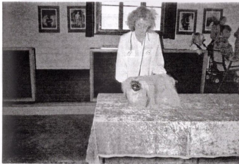
třída vítězů - feny