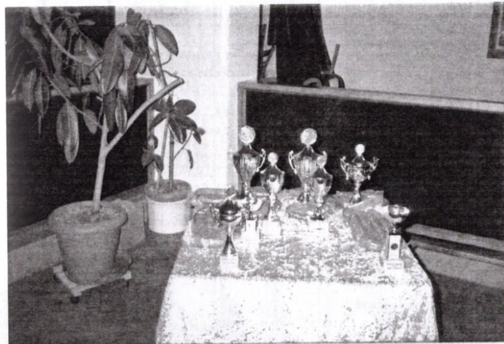
ceny pre vítěse Klubové výstavy věnova- klubem a sponzory Klubový vítěz-SIDNY of TOMDOR Svámí