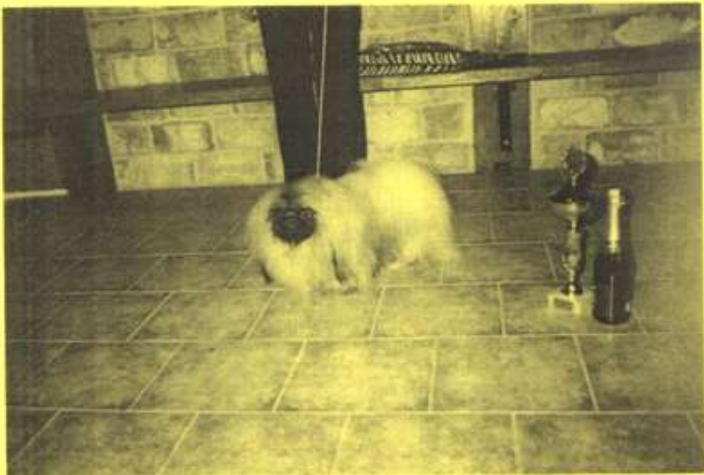
MENTIAR Targa Floris - Klubový vítěz, BOB

Vydává Pekinéz Klub redpovídá - Správní rada