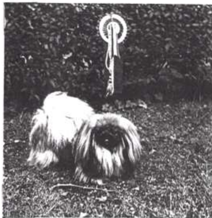
Faire Regal Svámí - CAC, CACIB, HPGY