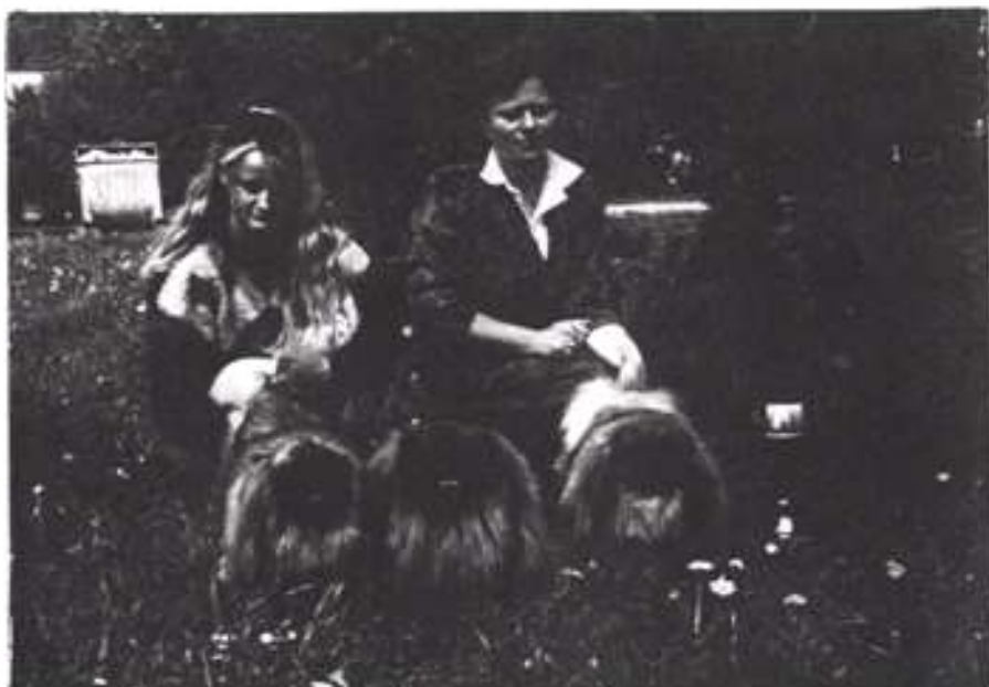
Nejúspěšnější jedinci MV České Budějovice se svými majitelkami. CH. Manuela Ikarie, CH. Juan Valey, CH. Chaplin ze Smíchovského zámku.