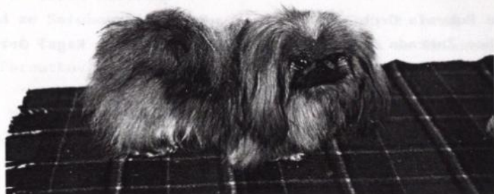
Evropská výstava LUXEMBOURG - Jugendsieger Luxembourg Juniorchampion Luxemboug