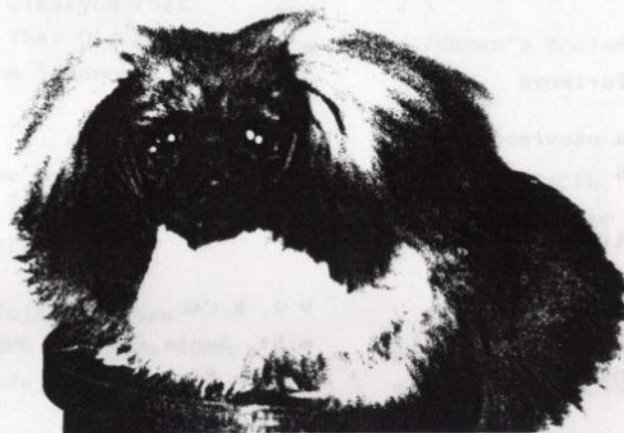
Primus Junior, Optimus Junior, VT /foto stáří 6 měsíců/ Třetí místo na světové výstavě ve Vídni 1996.- ve třídě mladých Chov.+maj.: Vitujová Olga