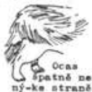
Ocas špatně nesený-ke straně