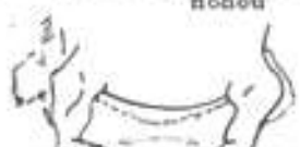
Špatný postoj vybočené lokty a široký postoj