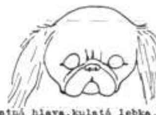
Špatná hlava, kulatá lebka, sevřený čenich, úzká a krátká dol. partie