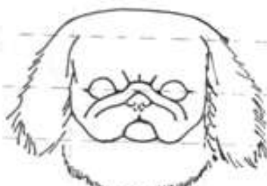
Špatné rozložení vrásek