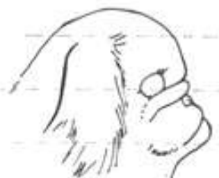
Nesprávný profil příliš ustupující čenichová partie