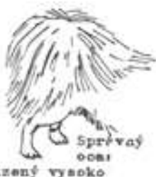
Správný oční nasazený vysoko