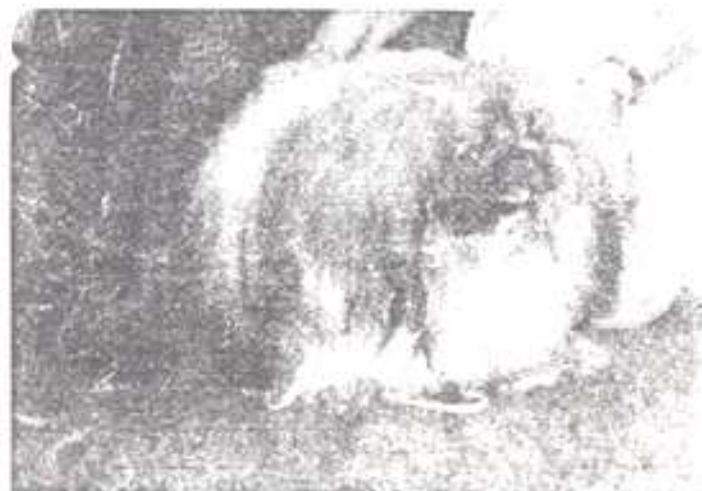
CHICKEN CHICKEN CAG, CAGIS, AVKOPNEY VITSE