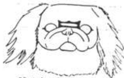
Přední vrásky správného typu