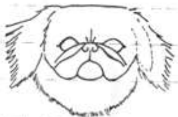
Správná hlava - fena