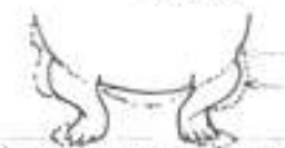
Správný postoj předních nohou