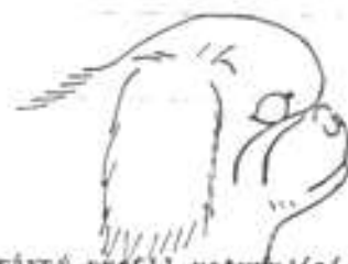
Nesprávný profil, ustupující dolní partie