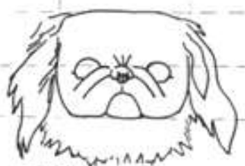
Správná hlava - pes