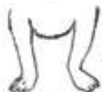
Příliš dlouhá přední noha