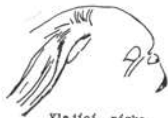
Vlající, nízko nasazené ucho