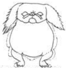
Správná ovlková přední fronta