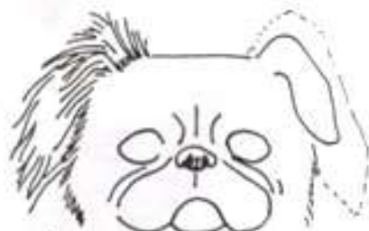
Vysoko nasazené ucho krátké