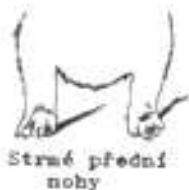
Strmé přední nohy