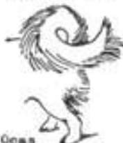
Ocas špatně nesený a krátce stočený