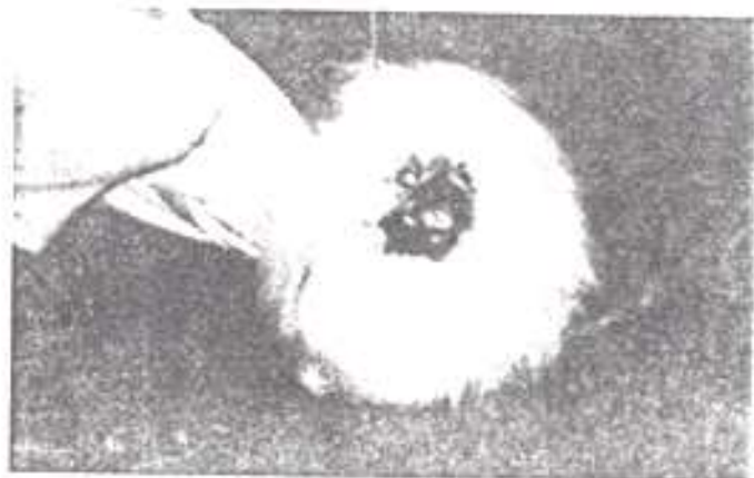
CHICKEN CHICKEN CAG, CAGIS, AVKOPNEY VITSE