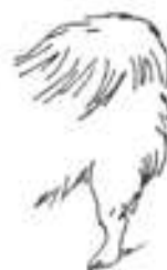
Stružý zadní postoj