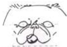
Tlanka s vystupujícím jazykem (vyfarukující vada)