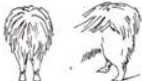
Správný postoj zadních nohou