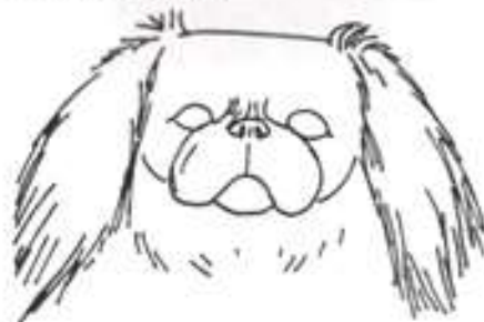
Uši správně nasazené a nesené