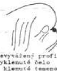
Nevytážený profil vyklenuté čelo křivé těleso