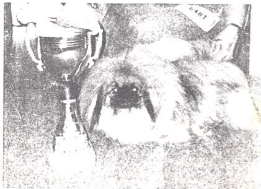
CHICKEN CHICKEN CAG, CAGIS, AVKOPNEY VITSE