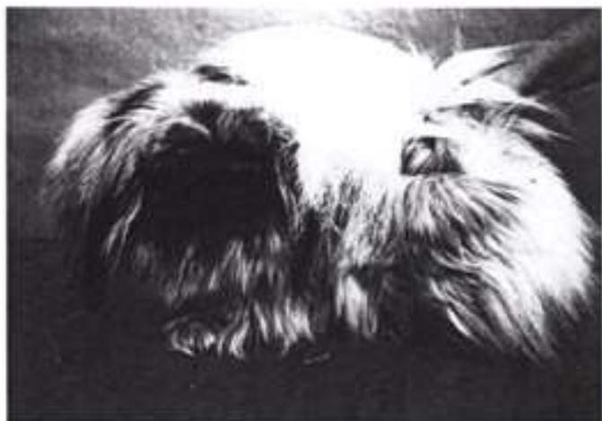
zpracovala : Ivana Krčmová

od 1.1.1996 průkazy původu pro náš klub vystavuje plemenná kniha ČMKU č. 1, U Pergamenky 3, Praha 7. Od stejného data, jak jsme Vás již dříve informovali, vznikla též povinnost označovat všechna zvířata (tetováním). Proto tedy v papírování ohledně vrhu dochází k malé změně. Současně s KL dostanete Přihlášku k zápisu štěňat a formuláře na Přejímku vrhu jak tomu bylo dosud a navíc ještě Žádanku o tetovací čísla.