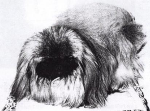
Připravila H. Kolská