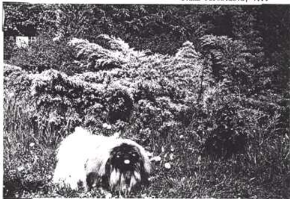
CH. Assai Zlatý Orion - Klubový vítěz, CAC, BOB