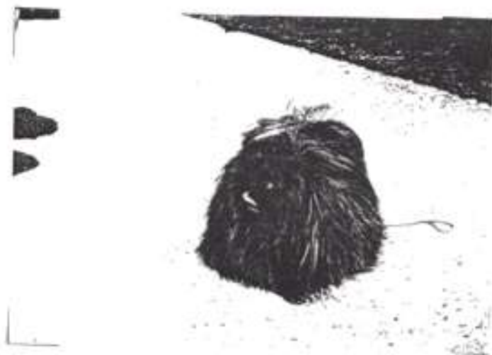
Oakmere Sir Harry - CAC, W.CACIB MV Mladá Boleslav