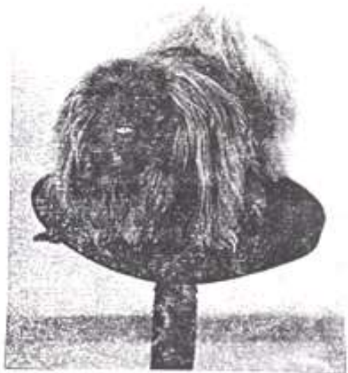
Fantazie Rogal svámi - CAG, KV, DOR na SV 100