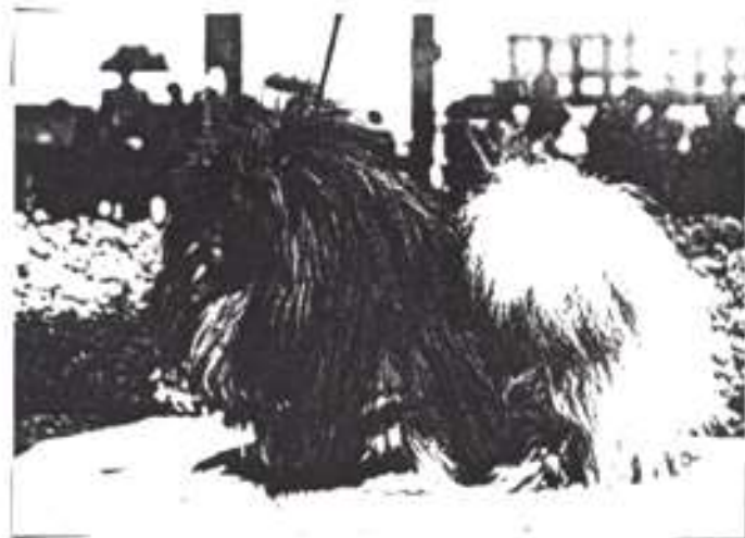
CH. Barry Ikarie - CAC, CACIB MV Mladá Boleslav